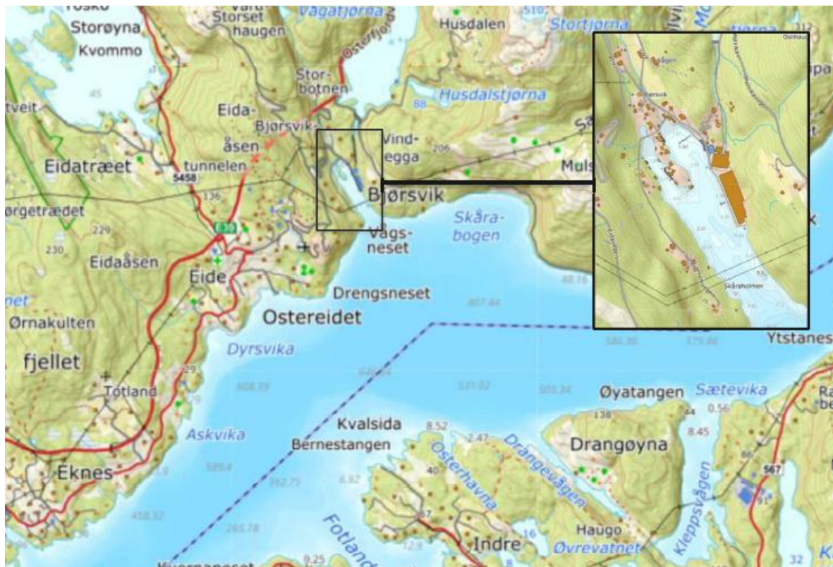
Figur 2: Tiltaksområdes lokalisering.

Ferskvatn vert henta frå Husdalsvatnet, som ligg om lag 40 meter høgare enn anlegget, og vert ført til anlegget ved sjølvfall. Oppvarming av vatn skjer ved bruk av varmpumpe og varmevekslar med sjøvatn.