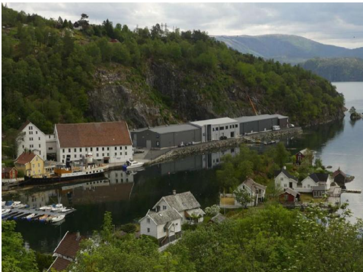
Figur 1: Bjørsvik planområde