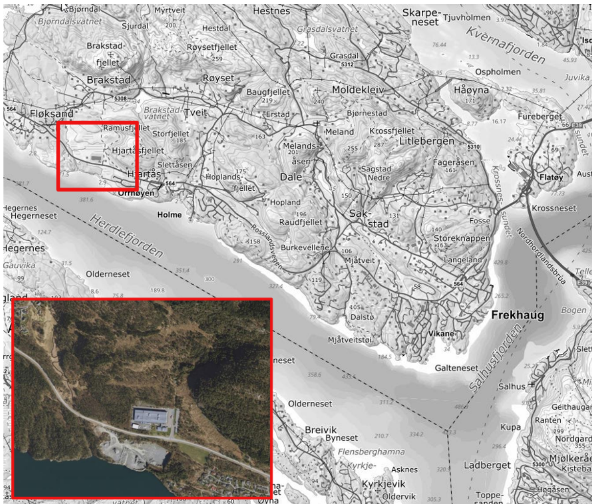
Figur 1: Tiltaksområdets beliggenhet.