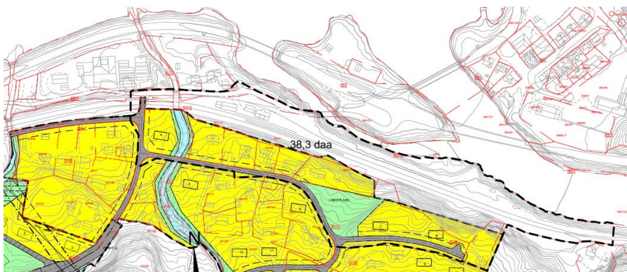
Figur 3: Kartet viser den delen av planområdet som vil overlappa reguleringsplan for Evanger prestegård. Gult er bustadformål og grønt er friområde (leik).

Den delen av området som er regulert i dag er vist i figur 3 under. Planen heiter Evanger prestegård, og er ein eldre bustadplan frå 1979, planid: 79001. Det er ikkje intensjonar om å endre formåla, men delar av det ubygdde bustadområdet i aust, kan ved trong verte nytta til mellombels rigg- og anleggsområde.