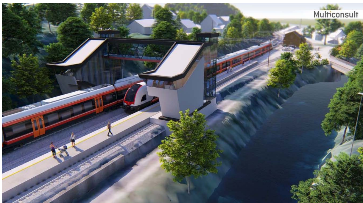
Figur 2: Illustrasjon av planfri kryssing som overgang.