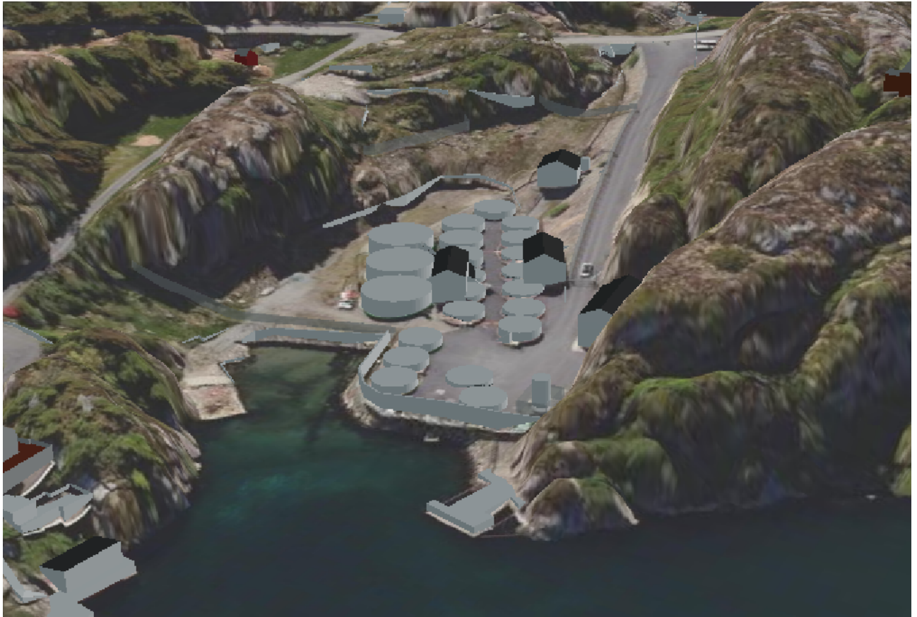
Figur 3: Planområdet, kjelde: Eit 3-D Kartutsnitt frå kommunekart