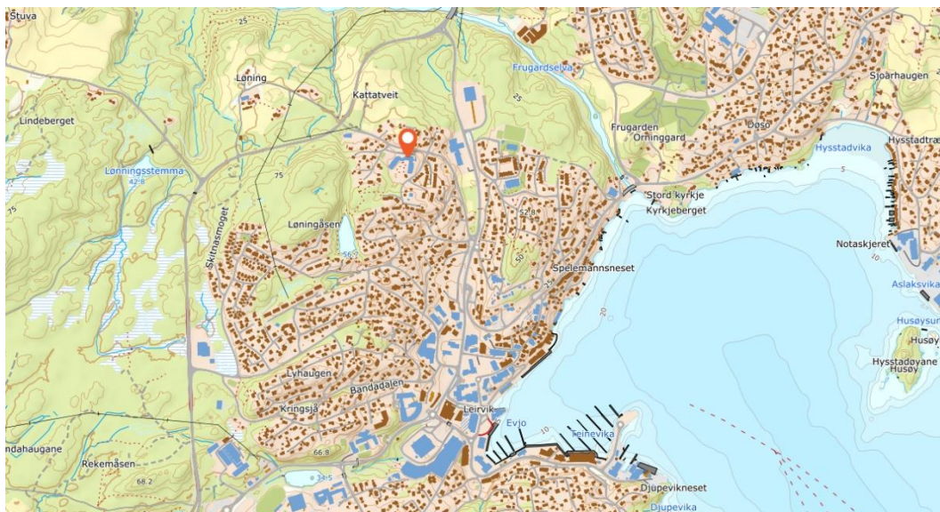
Figur 3: Flyfoto som syner omsorgssenterets plassering (Norgeskart).

Planområdet ligg mellom fylkesveg 544 og E39, i underkant av ein kilometer frå Leirvik sentrum. Nærområdet er prega av ein bustadar og skog i sørvest.