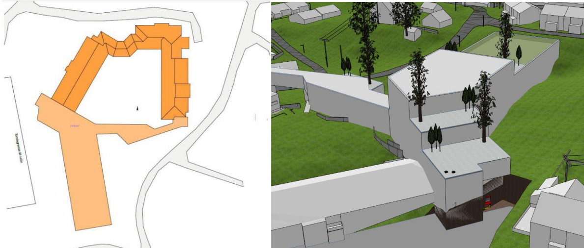
Figur 5: Førebels forslag til utforming, der mørk oransje er eksisterande bygning og lys oransje er utvidinga.

Figur 5 syner førebels forslag til utforming av nytt bygg.