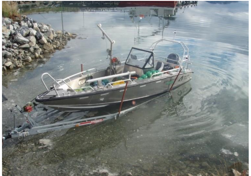
Instrumentrigging og operasjon i felt