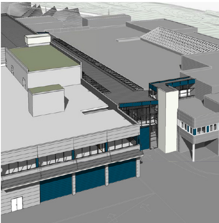
Perspektiv LMB | 3D: Astrup & Hellern AS