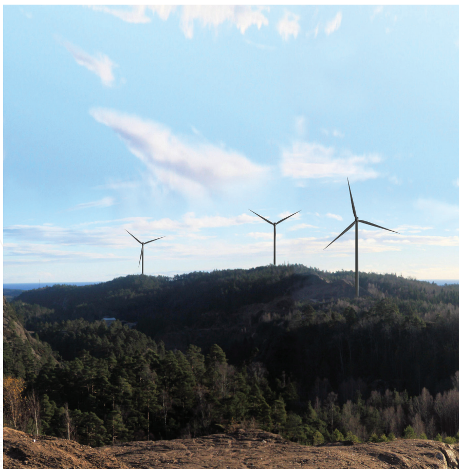
Fotomontasje av E18 vindpark

Gjennom datterselskapet NORPLAN har Multiconsult også lang erfaring med å vurdere og utrede miljømessige og sosiale konsekvenser i tilknytning til internasjonale prosjekter. Vi har også lang erfaring fra regionene Afrika sør for Sahara og Himalaya.